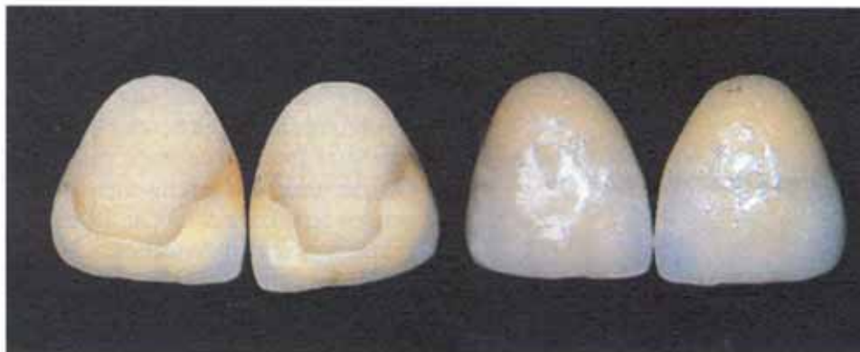
0,5 mm dünne Keramikschalen, die den gesamten sichtbaren Bereich der Zähne bedecken und sich je nach Situation etwas über die Schneidekante erstrecken. Sie werden aus einer keramischen Masse in jeweiligen Zahnfarbe hergestellt.

Warum Sie sich ein verbessertes Aussehen für Ihre Zähne wünschen, kann viele Gründe haben: Vielleicht ist Ihr sonst so