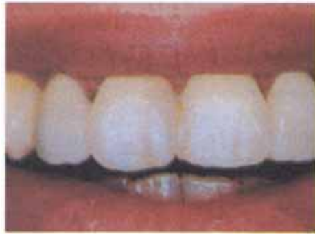
Ein unfallgeschädigter Zahn wird mit Hilfe eines Veneers aufgebaut. Der versorgte Zahn ist von den unbeschädigten Zähnen nicht zu unterscheiden.

Ihre Zähne müssen viel aushalten: Täglich haben sie hart zu arbeiten, müssen beißen und kauen und dabei ungeheurem Druck standhalten; Ihnen beim Sprechen helfen und oben-dreien auch noch schön aussehen. Es gibt also viele Gründe, pfleglich mit Ihren Zähnen umzugehen.