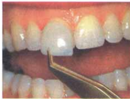
Ein Veneer wird auf den Zahn aufgeklebt.

Sollte es aber trotzdem soweit gekommen sein, so gibt es auch dann noch eine Möglichkeit. "Veneers" nennen wir Zahnärzte die grazilen, fast transparenten Keramikschalen, mit denen die sichtbaren Oberflächen Ihrer Zähne ein perfektes, fehlerfreies Aussehen erhalten.