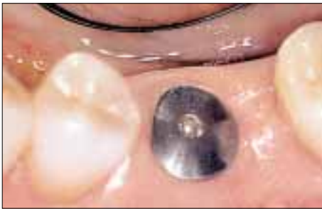
Andersartige Versorgung: Situation 10 Wochen nach Setzen eines Implantats, im Bild ist das Implantat mit einer Einheilkappe versehen.