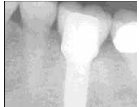
Röntgenbild der implantatgetragenen Krone.