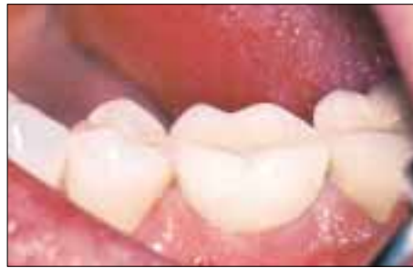
Restauration mit einer vollverblendeten metallkeramischen Krone über dem Implantatkörper.