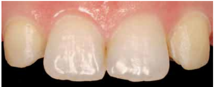
Bei einer Patientin sind die seitlichen Schneidezähne nicht angelegt; die Eckzähne sind an die mittleren Schneidezähne herangerückt. Sie wurden für die Aufnahme von Veneers (Foto unten rechts) präpariert, um sie zu verbreitern, damit sie optisch die Funktion der Schneidezähne übernehmen können.

Für Patienten mit hohen ästhetischen Ansprüchen empfehlen sich vor allem im Frontzahnbereich Keramikkrone. Die Verbesserung der Stabilität der Keramik hat interessanterweise auch bewirkt, dass die geringe jährliche Misserfolgsquote von Vollkeramikkrone gegenüber ihren eigentlich bewährten Vorgängern, den verblenden Metallkrone, um das Drei- bis Vierfache niedriger ist (0,6 bis 0,8 Prozent gegenüber 2,9 Prozent).