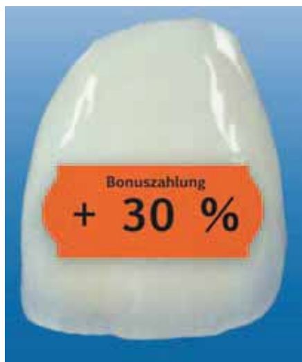
Die gesetzlichen Krankenkassen zahlen bis zu 30 Prozent mehr Festzuschuss zu Zahnersatz, wenn man regelmäßige Zahnkontrollen nachweist

Über die Kosten der jeweiligen Versorgung berät Sie der Zahnarzt rechtzeitig vor der Behandlung.