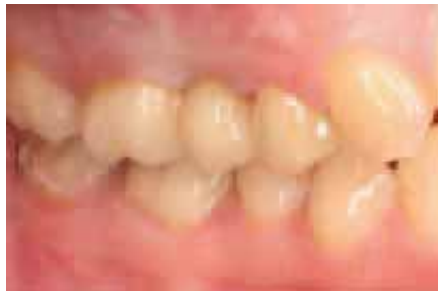
Die fertige Keramikbrücke im Mund des Patienten

Wie auch bei den Einzelkronen und Inlays sind es in erster Linie die ästhetischen Vorteile dieses Materials, die den Wunsch danach beflügeln. Hinzu kommen auch hier die hohe Biokompatibilität und die geringe Wärmeleitung, die den Tragekomfort erhöhen. Bei der Entscheidung für oder gegen die vollkeramische Brückenversorgung muss neben den zu erwartenden Kaukräften und der Spannweite der Brücke auch das Platzangebot im Kiefer für das etwas größer zu dimensionierende Brückengerüst in Betracht gezogen werden. Denken sollte man aber auch daran, dass die Lichtdurchlässigkeit der Keramik sich möglicherweise bei den Pfeilerzähnen negativ auswirken kann: Wenn nämlich der Zahnstumpf, auf den die Krone gesetzt wird, zu dunkel aussieht, kann das die Ästhetik beeinträchtigen, die doch der Hauptgrund für die Wahl der aufwendigen und teuren Versorgung war. Zwar