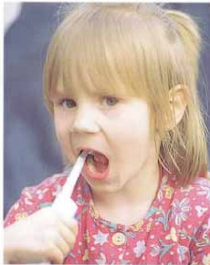
Kindern macht die E-Zahnbürste Spaß

Das Borstenfeld sollte nicht länger als 25 bis 30 Millimeter sein. Diese Kurzkopfbürsten sind sehr „wendig“, man kommt damit bis in den jeden Winkel des Mundes und kann auch den hintersten