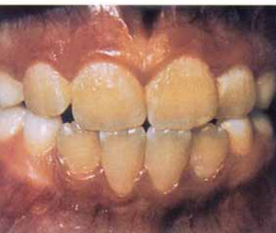
Zahnbeläge sind der Nährboden für Bakterien

immer neue Bakterien an, weil sie hier einen guten Nährboden finden. Mit der Zeit weichen die Säuren unter dem Zahnbelag die schützende Schmelz-