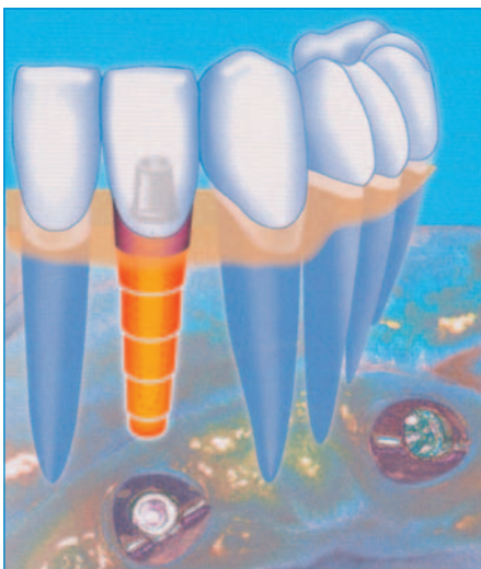
Beispiel für den Ersatz eines einzelnen Zahnes (Abbildung Georg Thieme Verlag 2006)

Zahnimplantate sind Schrauben oder Zylinder aus Titan oder Keramik, die vom Hauszahnarzt oder Oralchirurgen in den Kiefer eingebracht werden. Auf diese künstliche(n) Wurzel(n) kann der Zahnarzt Kronen, Brücken oder Prothesen befestigen. Interessant ist in diesem Zusammenhang, dass auf einem Implantat im Laufe der Zeit alle Versorgungsformen möglich sind. Ein Implantat für eine Krone kann zum Beispiel zu einem späteren Zeitpunkt zur Befestigung einer Prothese dienen.