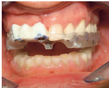
Links: Eine vorbereitete Schiene für die Operation – mit Pins für die Navigation während der OP. Rechts: Umgearbeitete Schiene nun mit Bohrhülsen – an der künftigen Position im Mund.

Das Einbringen eines Implantates ist immer eine operative Behandlungsmaßnahme, die sorgsam geplant und vorbereitet werden muss. Seit der Einführung der Implantologie sind die Methoden, Werkstoffe immer weiter erforscht worden, um so „minimalinvasiv“ wie möglich zu behandeln.