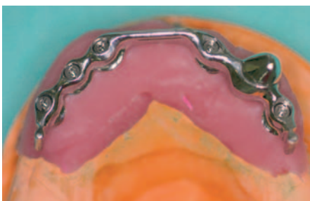
Bei diesem Patienten funktionierte im Oberkiefer die Sofortversorgung und -belastung: oben ist der Oberkiefer-Steg mit fünf Implantaten und einem natürlichen Zahn am Modell zu sehen

Implantate für Einzelkronen können selten sofort belastet werden. Für Brücken sollte man in diesem Fall mindestens drei Implantate/eigene Zähne zur Verfügung haben. Ist eine Sofortbelastung bei herausnehmbarem Zahnersatz geplant, so sollten im Oberkiefer sechs Zähne und/oder Implantate und im Unterkiefer vier Zähne und/oder Implantate vorhanden sein. ■