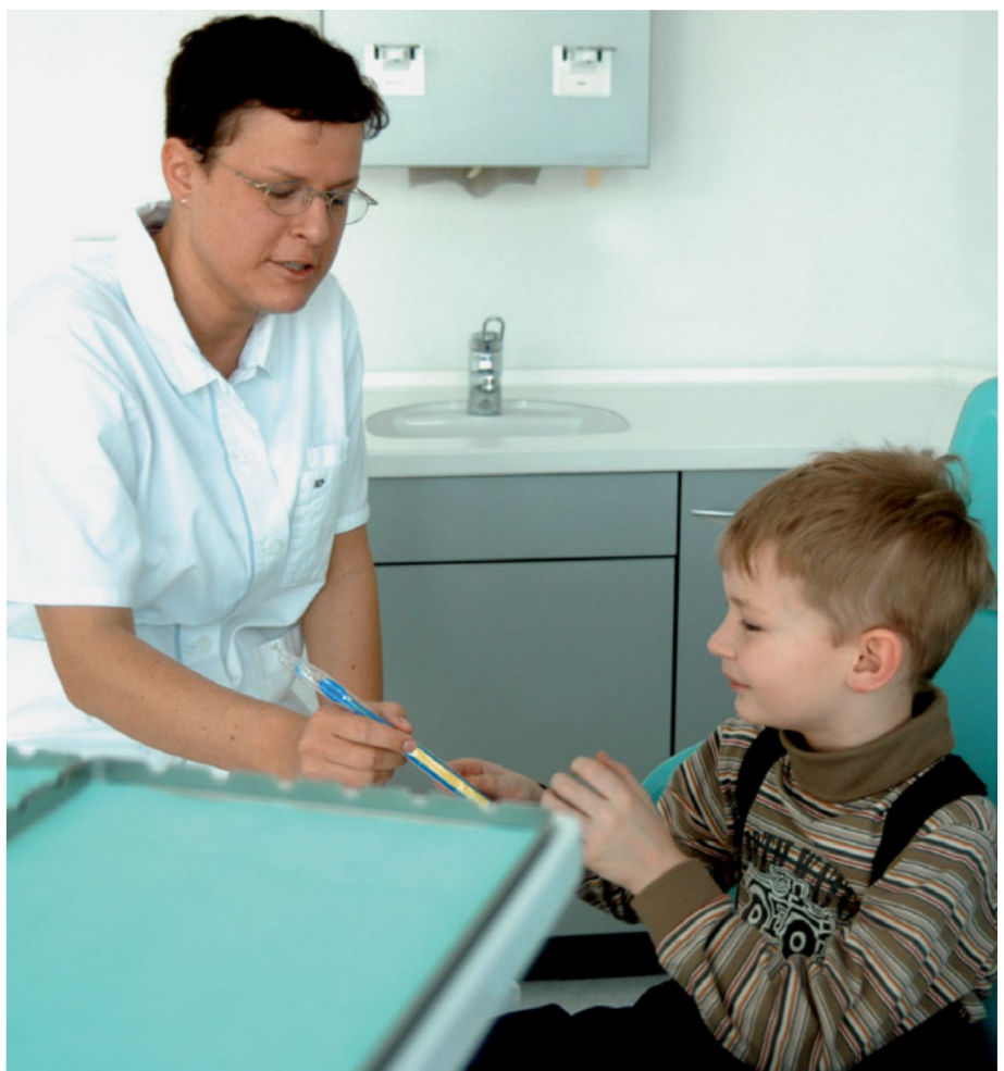
Eine Belohnung am Ende der Behandlung motiviert das Kind zusätzlich.

Die Hypnose für Kinder funktioniert etwas anders als bei Erwachsenen, denn gerade kleine Kinder können sich noch nicht über einen längeren Zeitraum konzentrieren. Ihre Aufmerksamkeit wird mit Geschichten, Zaubertricks, Handpuppen oder kleineren Späßchen gefesselt. Im besten Fall entsteht damit erst gar keine Zahnarztangst. Auch naturell bedingte ängstliche Kinder lassen sich mit Hypnosetechniken gut von der Behandlung ablenken.